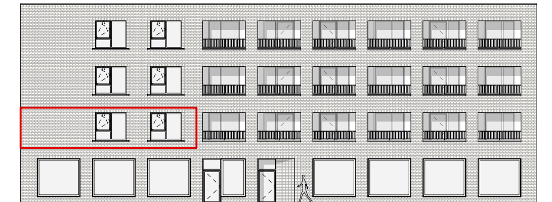
GEVEL - ZUID