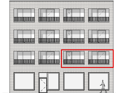
GEVEL - WEST