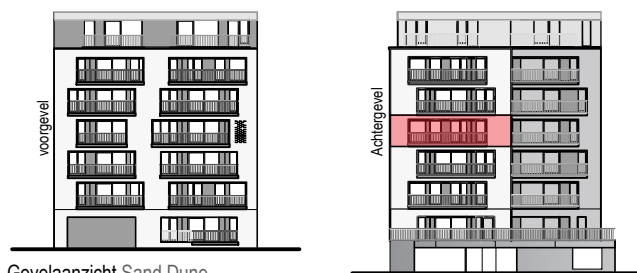
Gevelaanzicht Sand Dune