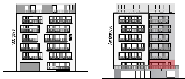
Gevelaanzicht Sand Dune